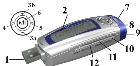
Ilustração do Produto